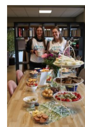
Vakantie Bijbel Club - Maaltijd bij zondagse bijEENkomst - Missionair kinderwerk - High team in de wijkwinkel

Persoonlijk ben ik onder de indruk hoe De Wegwijzer zich door de jaren heeft ontwikkeld als missionaire kerk. Dat is door hoogten en diepten gegaan. Juist in deze weg komt de kracht van het Evangelie aan het licht voor de stad, ook in onze tijd. Ik vind het een voorrecht om hierbij betrokken te zijn.